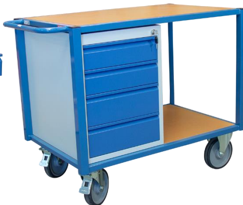
880 002 988 – 1 bloc tiroirs