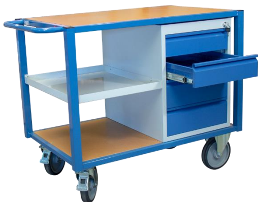
880 002 989 – ½ plateau tôle + 1 bloc 4 tiroirs