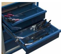
882 006 036 – Cloisonnements pour tiroirs hauteur 100 mm, soit les deux premiers tiroirs. 6 cloisons incluses.