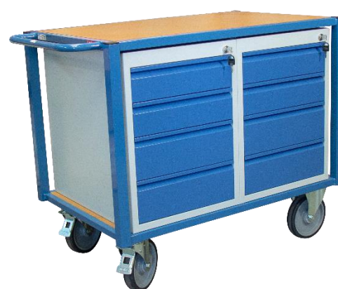
880 002 990 – 2 blocs tiroirs