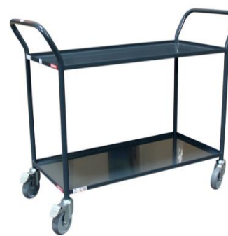
Servante plateaux tôle Capacité 200 kg