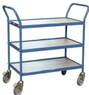
Servante 2 poignées vertical Capacité 150 kg