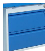
882 006 038 2 tiroirs sur plateau 1000 x 600 mm. Dimensions 460 x 600 x 380 mm. Livré monté.