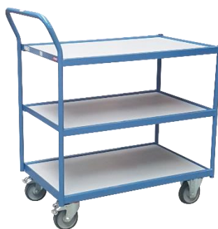
Servante 1 poignée horizontale Capacité 250 kg