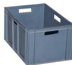
802 006 767 Bac 76,8 L 600 x 400 x 320 mm