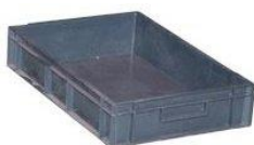
802 006 765 Bac 28,8 L 600 x 400 x 120 mm