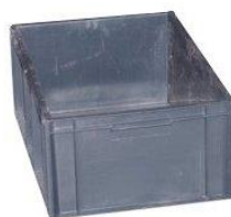
802 006 766 Bac 56,4 L 600 x 400 x 235 mm