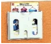
802 000 001 Porte document plastique autocollant