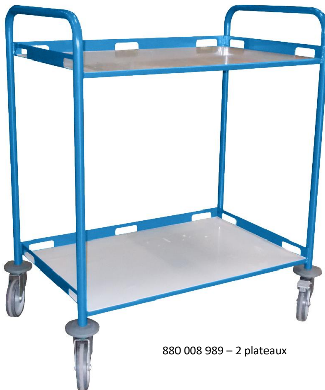
880 008 989 – 2 plateaux