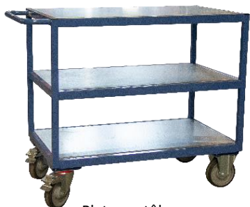
Plateaux tôle CU 400 kg