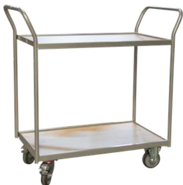
Desserte double poignées CU 250 kg