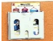
802 000 001 Porte document plastique autocollant