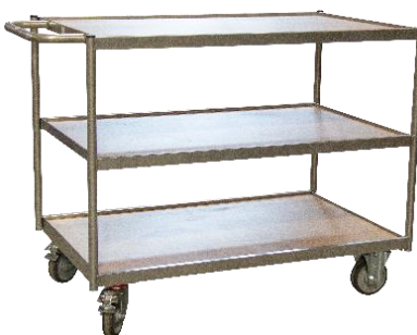
Desserte poignée horizontale CU 250 kg