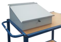
882 006 039 Pupitre à poser avec écrioire verrouillable 440 x 520 mm.