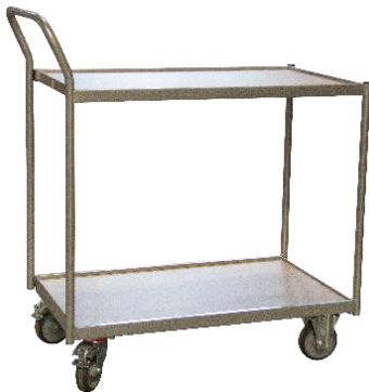
Desserte poignée verticale CU 250 kg