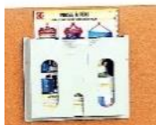
802 000 001 Porte document plastique autocollant