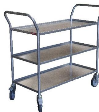
Desserte plateaux tôle CU 200 kg