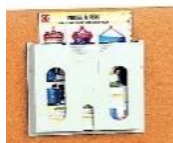
802 000 001 Porte document plastique autocollant