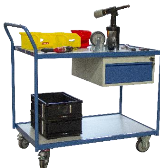
Poignée verticale, équipée 1 tiroir, CU 250 kg