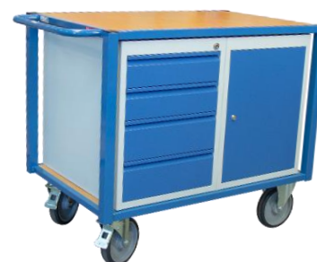
Servante CU 500 kg équipée 1 bloc tiroirs + 1 bloc porte