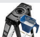
MINI BAC 382200