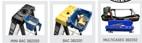
MINI BAC 382200

MASTERSCOP 6/9 4 HAUTEUR DE TRAVAIL : DE 3.50 À 4.30 M