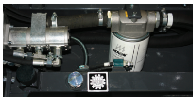
Réservoir d'huile hydraulique incorporé au châssis

Le CARRY 107 est un mini-transporteur hydrostatique compact. Il est équipé d'un circuit hydraulique auxiliaire permettant d'ajouter des accessoires hydrauliques. Le montage de la benne est simple. Il est également possible de remplacer la benne par d'autres accessoires (autres modèles de bennes; petites bétonnières ...). Il existe en 2 versions : Essence avec moteur KOHLER CH440 10,5 kW, ou version Diesel avec moteur YANMAR L100 7.4 kW.