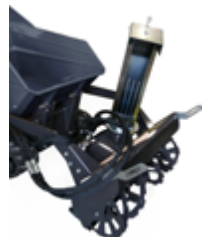
SOUFFLEUR À NEIGE