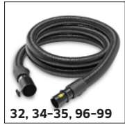
32, 34-35, 96-99