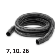
7, 10, 26