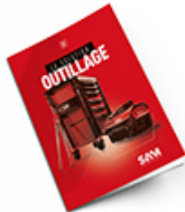
Outillage 2021 Consulter le catalogue