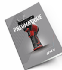
Pneumatique 2021 Consulter le catalogue