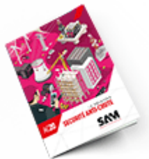
Sécurité anti-chute 2020 Consulter le catalogue