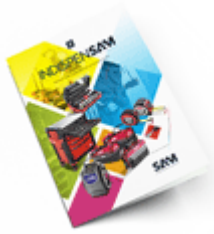
Les outils Indispensables SAM 2021 Consulter le catalogue

Découvrez tous nos produits dans nos catalogues en ligne