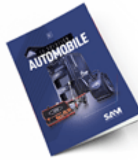
Automobile 2021 Consulter le catalogue