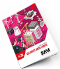
Sécurité anti-chute 2020