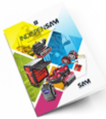
Les outils Indispensables SAM 2021

Découvrez tous nos produits dans nos catalogues en ligne