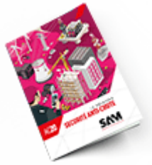
Sécurité anti-chute 2020