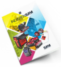
Les outils Indispensables SAM 2021