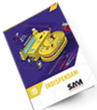
Les outils Indispensables SAM 2019 Consulter le catalogue

Découvrez tous nos produits dans nos catalogues en ligne