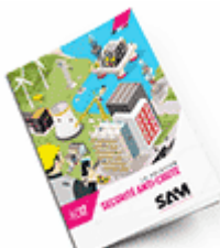
Sécurité anti-chute SAM 2017 Consulter le catalogue