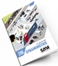
Dynamométrie SAM 2019 Consulter le catalogue