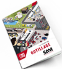
Outillage SAM 2019 Consulter le catalogue