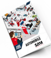
Automobile SAM 2019 Consulter le catalogue