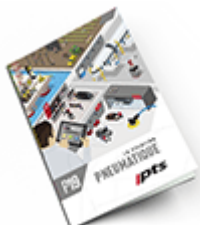
Pneumatique SAM 2019 Consulter le catalogue