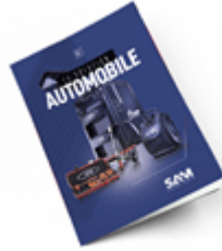
Automobile 2021 Consulter le catalogue