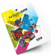
Les outils Indispensables SAM 2021 Consulter le catalogue

Découvrez tous nos produits dans nos catalogues en ligne