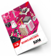
Sécurité anti-chute 2020 Consulter le catalogue