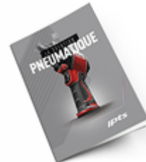
Pneumatique 2021 Consulter le catalogue