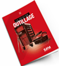
Outillage 2021 Consulter le catalogue