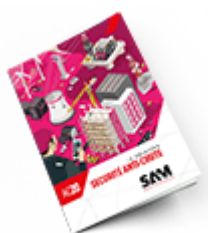
Sécurité anti-chute 2020