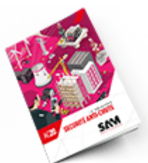
Sécurité anti-chute 2020