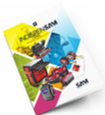
Les outils Indispensables 2021

Découvrez tous nos produits dans nos catalogues en ligne