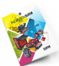
Les outils Indispensables 2021

Découvrez tous nos produits dans nos catalogues en ligne