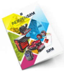
Les outils Indispensables 2021

Découvrez tous nos produits dans nos catalogues en ligne