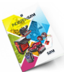
Les outils Indispensables SAM 2021

Découvrez tous nos produits dans nos catalogues en ligne