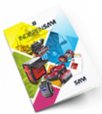
Les outils Indispensables SAM 2021

Découvrez tous nos produits dans nos catalogues en ligne