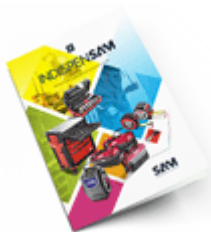
Les outils Indispensables 2021

Découvrez tous nos produits dans nos catalogues en ligne