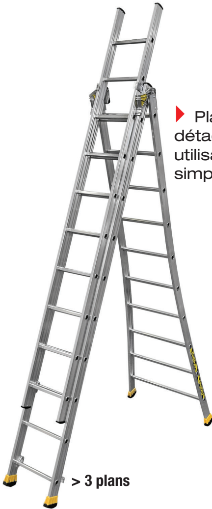
> 3 plans

► Plan supérieur détachable pour une utilisation en échelle simple**