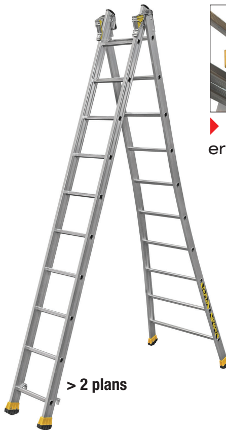
> 2 plans