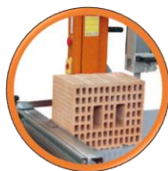
Convient de manière optimale pour le béton cellulaire et des briques