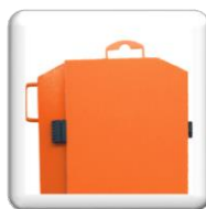
Dispositifs de levage