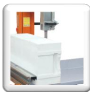
Profondeur coupe 500 mm