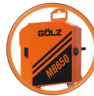
Volants de ruban de scie à dimension optimale garantissant une grande longévité du ruban de scie

Scie à brique à ruban robuste et mobile avec table de coupe repliable permettant la coupe de briques de grande dimension.