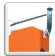
Barre de transport (accessoire)