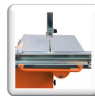
Table de coupe à charnière double