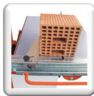
Butée angulaire (0-90°)