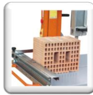
Table de coupe coulissante