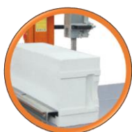
Arrêt automatique du ruban en fin de coupe