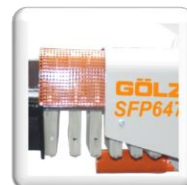
Chambre à filtres