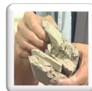
Galettes de boue pressée