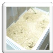
Bac de récupération