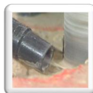
Aspiration des boues de chantier