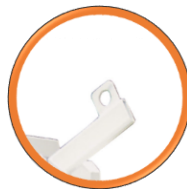
Crochet de levage