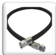
Jeux de flexibles hydrauliques