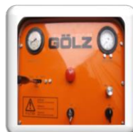
Pupitre de commande rationnel