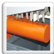
Évacuation de l'eau filtrée