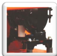
Pompe à membrane pneumatique 6 bars