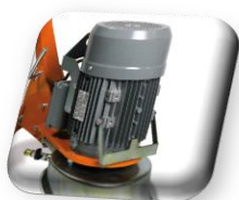
Moteur électrique 230 V, 50/60 Hz / 2,2 Kw