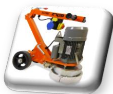
Machine repliable et démontable