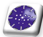
Plateau de ponçage CG250-M Medium inclus