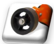
Grande roue, maintient facile