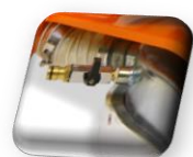
Raccordement externe à l'eau