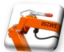
Poignée de manœuvre, pliage facile