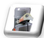
Anneau de levage