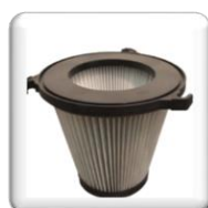
Filtre antistatique à cartouche en polyester Classe "M"