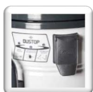
Système de nettoyage du filtre par guillotine pour système DUSTOP