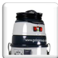
Enrouleur intégré pour rangement du câble.