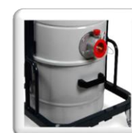
Bac collecteur de 20 L, extractible permettant un vidange pratique et en toute sûreté