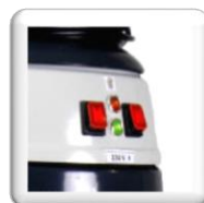
Démarrage par 2 interrupteurs indépendants