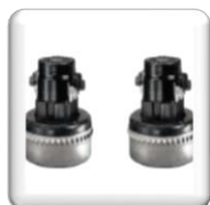
2 Puissants moteurs bypass monophasés