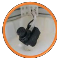
Pompe à induction sans entretien, ne demandant aucune maintenance