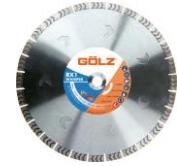
RX1 Gamme Excellence