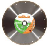
SLF20 Gamme Prémium