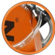
Double arrivée d'eau pour une meilleure qualité de coupe