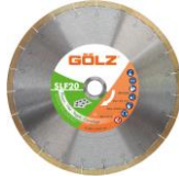
SlimFast Gamme Excellence