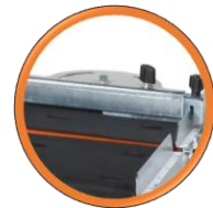
Système de coupe d'angle

Scie à pont robuste châssis aluminium, pour des coupes précises de grande longueur Granit - marbre - grès cérame - dalles béton.