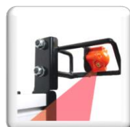
Indicateur de coupe laser