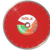
SF30 Gamme Excellence