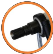
Emmanchement, raccord 1¼" UNC.