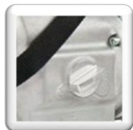
Sélecteur 3 vitesses