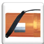
Moteur Triphasée 400 V de 5200 W