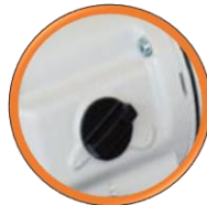
Sélecteur de 3 vitesses 120/280/440.