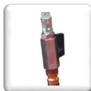
Raccord d'eau Gardena