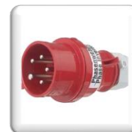
Prise 400 V avec inverseur de phase