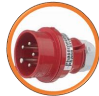
Prise 400 V avec inverseur de phase.

Moteur électrique de carottage professionnel triphasé.