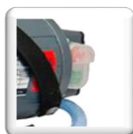
Interrupteur marche / arrêt