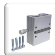
Plaque de fixation rapide STS