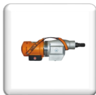
Moteur BBM33 L Extra, électrique 3,3 Kw