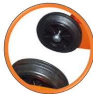
Roue de transport inclus