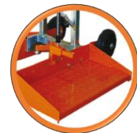
Jeu de Marchepieds inclus

Carotteuse GÖLZ KB200 électrique avec moteur Bender BBM33 L Extra, pour prélèvement d'échantillons dans le béton & l'asphalte, pose de mobilier urbain & travaux routiers.