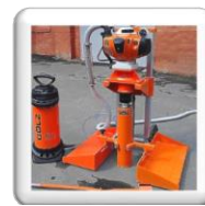
Carottage pour prélèvement d'échantillons