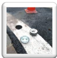
Carottage pour plots routier rétro réfléchissants jusqu'au Ø 280 mm