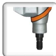
Emmanchement, Raccord 1 1/4" UNC