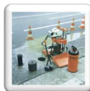
Carottage pour bouches à clé jusqu'au Ø 280 mm