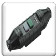
Sécurité Commutateur PRCD 30 MA