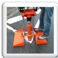
Le poids de l'opérateur assure un bon maintien