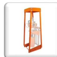
Kit Pelle en Option