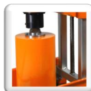
Emmanchement, Bride 3 trous