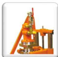
Moteur pneumatique LZL15 6-7 bar, débit d'air 3,3 m 3 /min