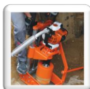
Carottage 90° sur tuyau d'assainissement. La carotteuse est coincée entre le tuyau et le blindage.

Piquet de terre pour sécurité supplémentaire