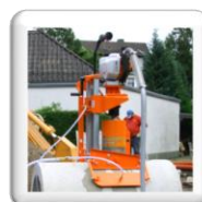
Carottage 90° sur tuyau d'assainissement. Fixation par ventouse (accessoire en option)

Piquet de terre pour sécurité supplémentaire