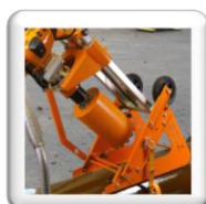
Carottage 45°. Fixation par sangle et cliquet (accessoire inclus)