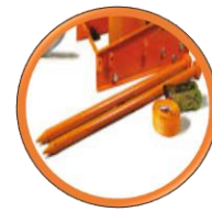
2 piquets de terre et 1 Sangle 2,1 m avec cliquet inclus

L'originale pour les canalisations, l'experte dans l'assainissement avec moteur pneumatique LZL15.