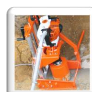
Carottage 90° sur tuyau d'assainissement. Fixation par piquet de terre (accessoire)