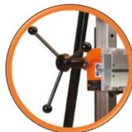
Volant de montée / descente en acier