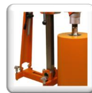
Renfort de colonne (en Option)