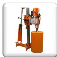
Bâti KB 400 avec renfort de colonne