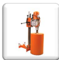
Bâti KB 400 sans renfort de colonne