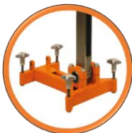
Socle à cheviller