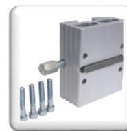
Fixation moteur STS