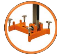
4 boulons de mise à niveau du socle

Carotteuse avec guidage aisé pour l'utilisateur professionnel jusqu'au \varnothing 400 mm ( \varnothing 600 mm avec élargisseur & renfort).