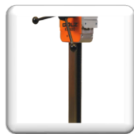
Colonne en inox avec crémaillère galvanisée