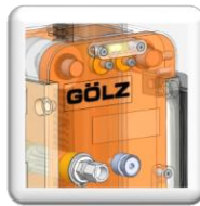
Guidage précis par roulements latéraux & glisseurs téflon