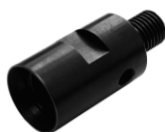
Adaptateur avec foret de centrage M 18 x 2,5 / M 16