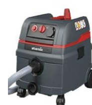
Aspirateur industriel IS1625