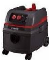
Aspirateur industriel IS1425