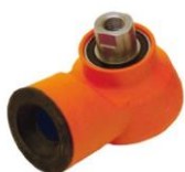
Adaptateur avec foret de centrage 6-pans / M 16