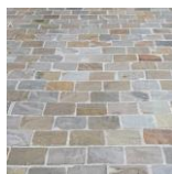
Grès des Indes