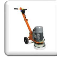
Pour ponceuses sol SM 250

Conseil : alternez les matériaux d'utilisation pour une meilleure longévité de l'outil.