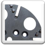
Polycristallins brasé à l'argent, hauteur 10 mm.