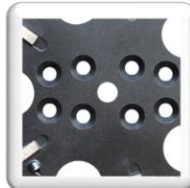
Différent perçage, pour adapté sur divers marques de ponceuse