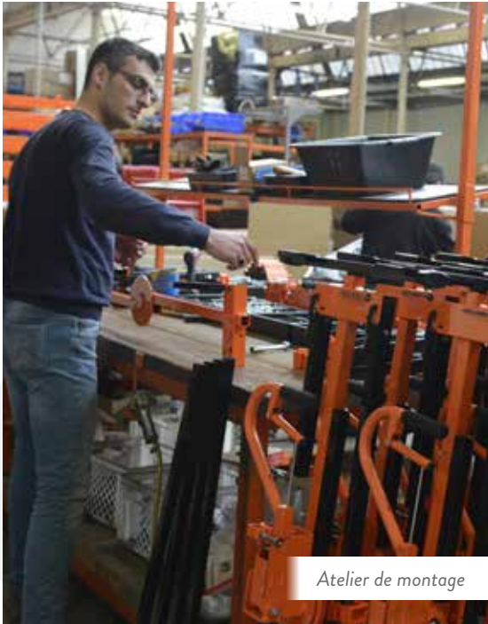
Atelier de montage

CHAQUE LEVPANO EST MONTÉ ET TESTÉ UNITAIREMENT