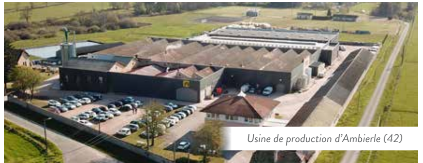
Usine de production d'Ambierle (42)