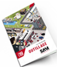
Outillage SAM 2019