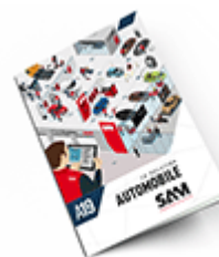
Automobile SAM 2019