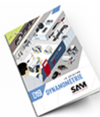
Dynamométrie SAM 2019