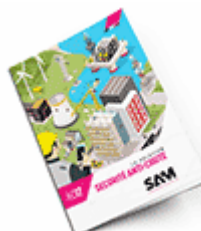
Sécurité anti-chute 2017 Consulter le catalogue