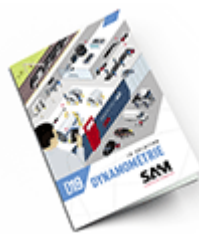
Dynamométrie 2019 Consulter le catalogue