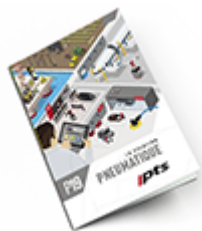
Pneumatique 2019 Consulter le catalogue