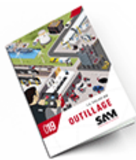
Outillage 2019 Consulter le catalogue