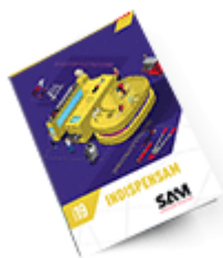
Les outils Indispensables SAM 2019 Consulter le catalogue