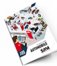
Automobile 2019 Consulter le catalogue