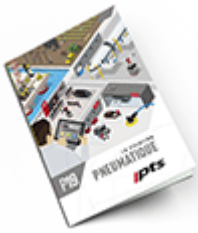
Pneumatique SAM 2019