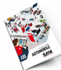
Automobile SAM 2019