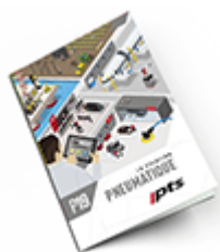
Pneumatique SAM 2019