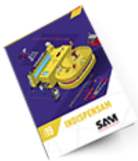
Les outils Indispensables SAM 2019

Découvrez tous nos produits dans nos catalogues en ligne