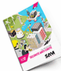
Sécurité anti-chute SAM 2017